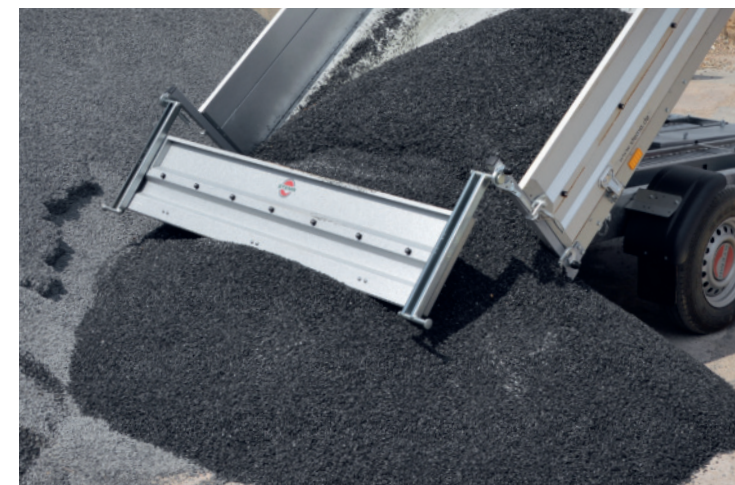
Rückwand als Pendelbordwand