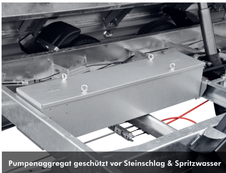
Pumpenaggregat geschützt vor Steinschlag & Spritzwasser