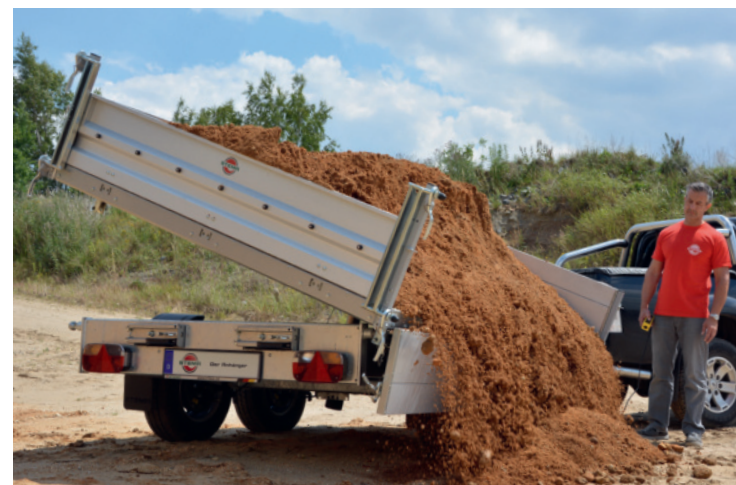
allseitig abklapp- und abnehmbare Bordwände