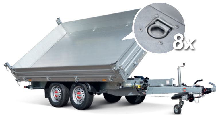
verzinkter Stahlblechboden mit versenkten Schwerlast-Zurringen