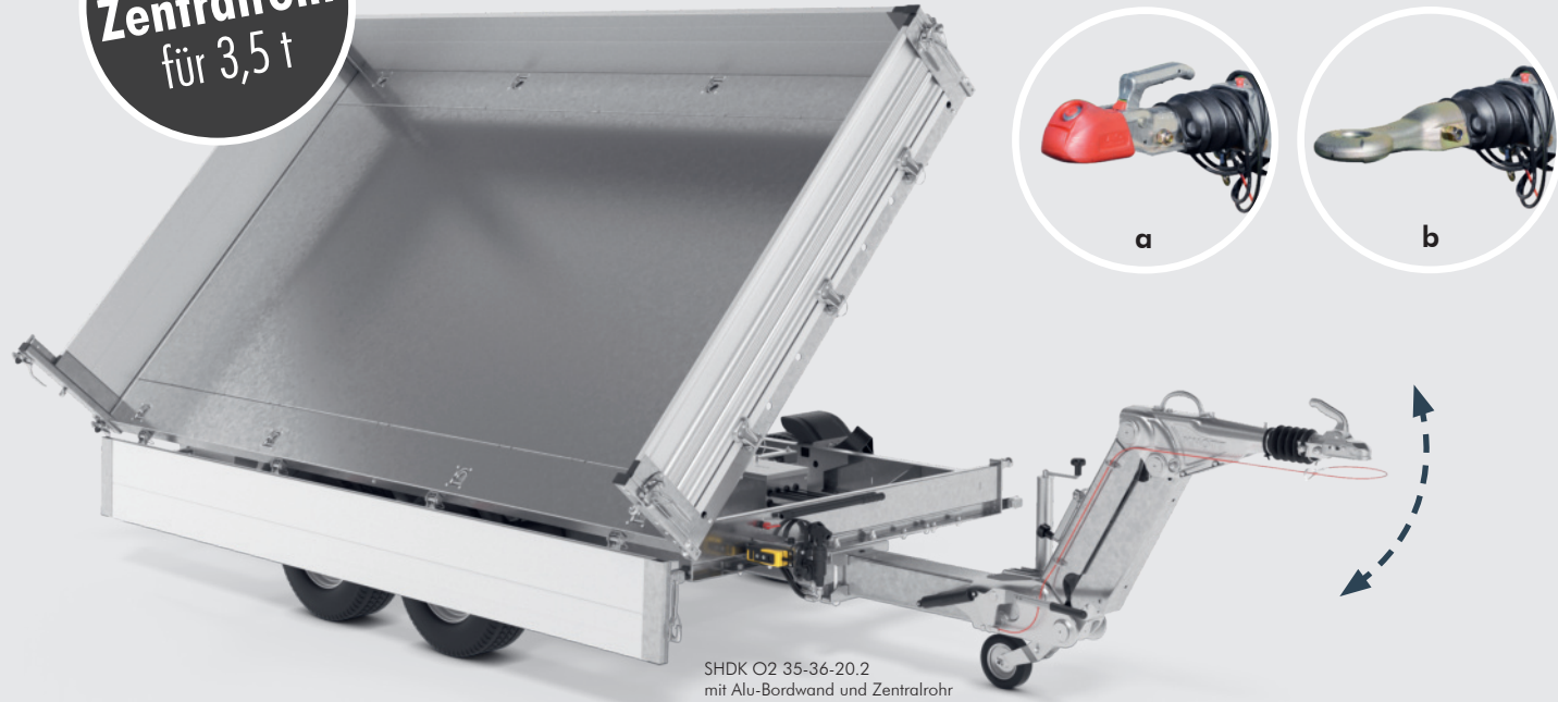
SHDK O2 35-36-20.2 mit Alu-Bordwand und Zentralrohr