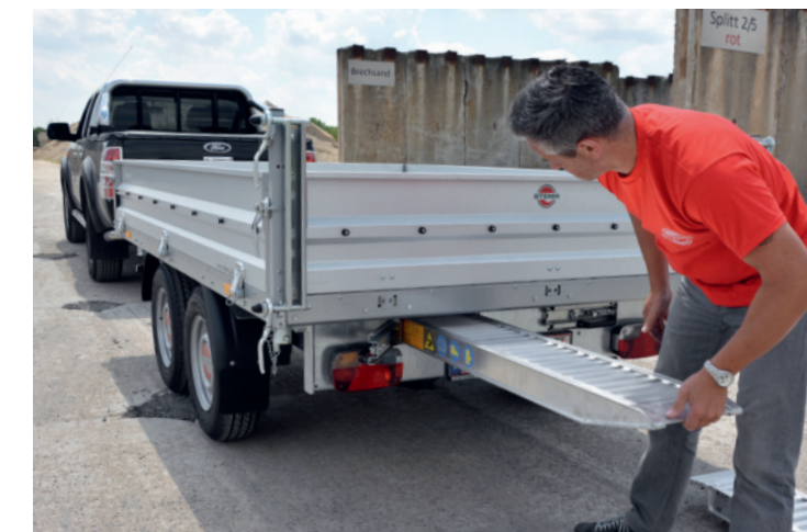
abschließbares Einschubfach für Auffahrampen (optional)