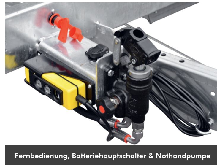
Fernbedienung, Batterie Hauptschalter & Nothandpumpe