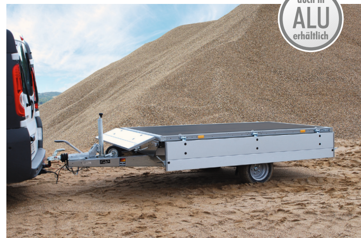
allseitig abklapp- und abnehmbare Bordwände