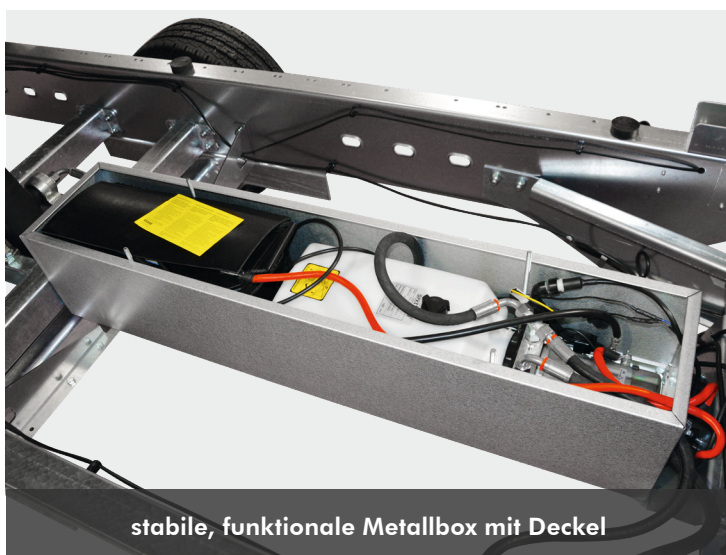
stabile, funktionale Metallbox mit Deckel