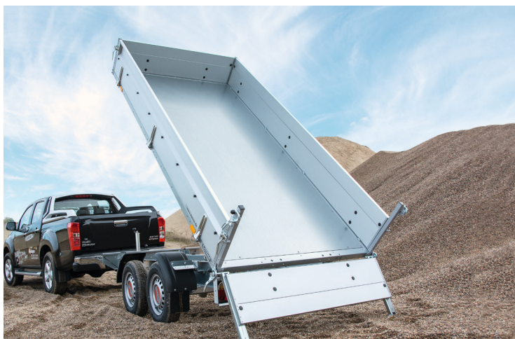
wasserfester Holzboden mit zusätzlich verzinkter Stahlblechauflage