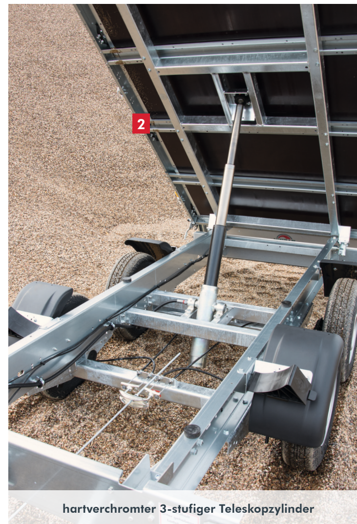
hartverchromter 3-stufiger Teleskopzylinder

Bilder sind Musterabbildungen und können Sonderausstattung enthalten.