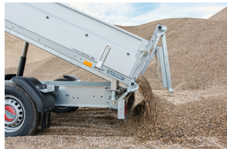
Rückwand als Klapp- oder Pendelbordwand