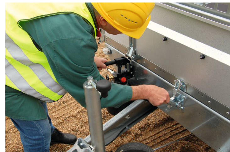
Schließsicherung für Kippbrücke