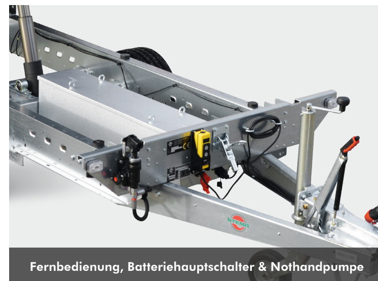
Fernbedienung, Batterie Hauptschalter & Nothandpumpe